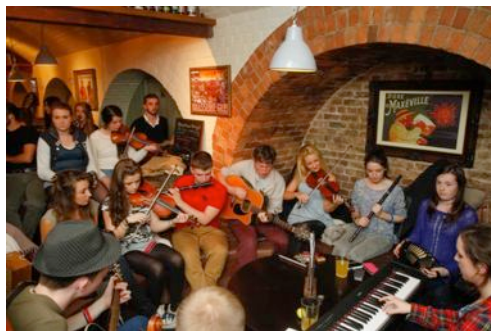
Seisiún i dTigh an Phórtair le déanaí.