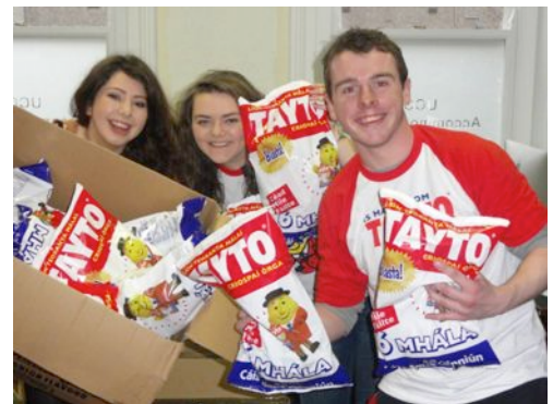
Seachtain na Gaeilge