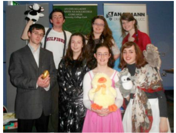
Seachtain na Gaeilge, Márta 2013