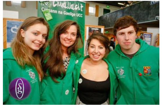
Lá na gCumann

Ríomhphost: anchuallacht@uccsocieties.ie Facebook: An Chuallacht UCC