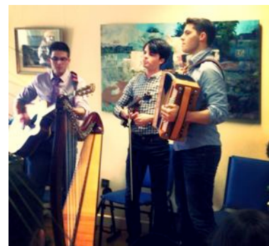
Mac Tíre ag seinnt sa tSeomra Caidrimh