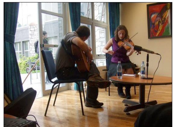
Ceolchoirm sa tSeomra Caidrimh le déanaí.