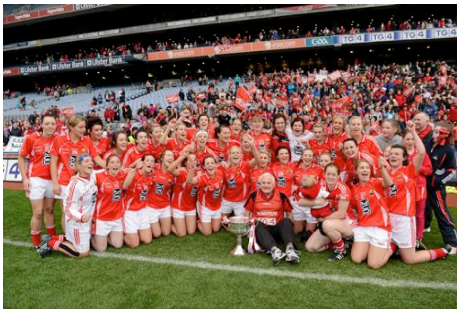
Éamonn Ó Riain agus foireann ban Chorcaí.