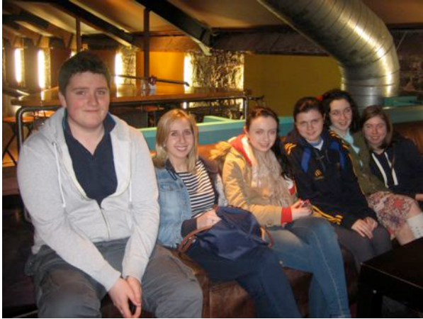
Cleas Áras Uí Thuama ag baint súip as a bheith ag babhláil sa Mhairdíog le déanaí.