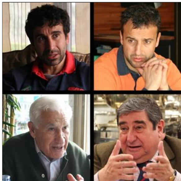
Los protagonistas del Superdepor durante las entrevistas.