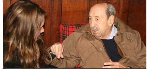
El marqués en su pazo de Ribadulla con la entrevistadora.

R. Porque la defensa de los que habían participado en el golpe decían que Armada les había dicho que el Rey estaba de acuerdo, cosa que yo no dije nunca.