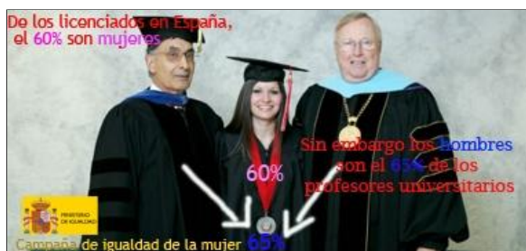
Campaña de igualdad de la mujer

A. I'd have to leave some things behind. When I left Ireland I was sad and I would miss my friends and my family, but now, once I leave, I'm going to be leaving a whole group of friends and another "family" and it's going to be very strange. One thing I will bring home is stuff to do with the Camino and a flag of Galicia. I now realize the Galician identity and I will take that back too.