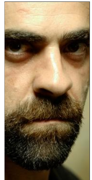
Luis en Celda 211 . / V. F.

R. Me gustaría tener todos los papeles del éxito [ Risas ], pero eso depende de todo el sector. Tenemos que ponerlos las pilas, pero creo que vamos por muy buen camino. Lo de Celda es la consecuencia de muchos trabajos muy bien hechos durante años. Tenemos profesionales de todo tipo en todos los estamentos del cine y nos estamos dando a valer.