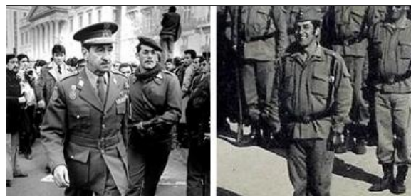
El general de vuelta del Congreso. // El capitán Fortes en Figueirido

muchas cosas pero del golpe no me habló nada". También confirma que habló con el general Miláns del Bosch y de algún modo lo excusa: "Miláns se sintió empujado cosa que no me pasó a mí. Él era monárquico se sintió empujado por hacer un gesto y se vio comprometido". La tarde del 23 de febrero el entonces general de división y segundo jefe del Estado Mayor del Ejército, Alfonso Armada, estaba en el cuartel general del ejército a una manzana del Congreso: "Yo le decía al general Gabeiras que no se podían meter los GEOS en el Congreso y que había que ir a parlamentar. Por eso fui allí a negociar con Tejero porque él no admitió hablar con Gabeiras y sí